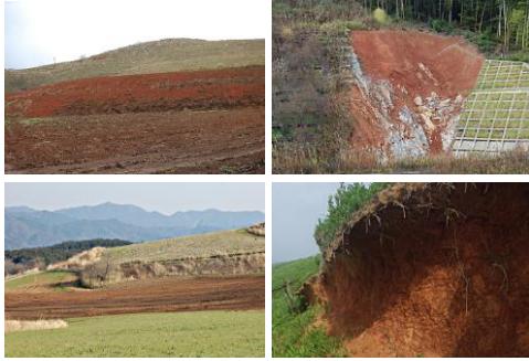
図1 秋吉台とその周辺の赤い土壤

秋吉台では、石灰岩の上に数m近く土（専門用語で土壤）がたまっています（図1）。土壤はその場の環境によって色々な見た目や性質を示すようになるため、秋吉台でも秋吉台の環境がこの土壤を作り上げています。この秋吉台の土壤は、昔から石灰岩（が溶けて残った不純物）から形成されると考えられてきましたが、近年では広域風成塵（以下、風成塵；中国大陸の砂漠地帯などから飛来してくる微粒子）が土壤の生成に強く影響を与えているという見解が主流になっています。ところが、秋吉台の土壤